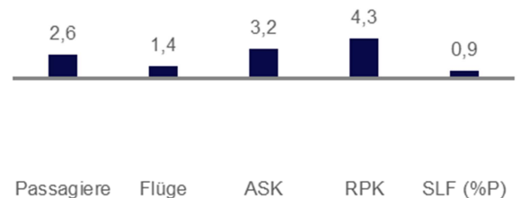
Verkehrsleistung nach Regionen (Monat Veränderung ggü. VJ in %)